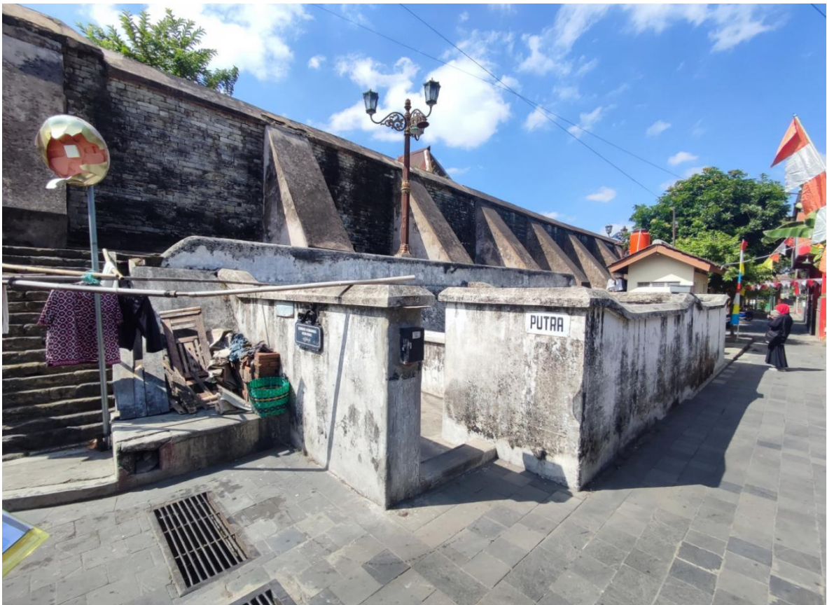
Gambar 1. Sumber Kemuning dilihat dari utara