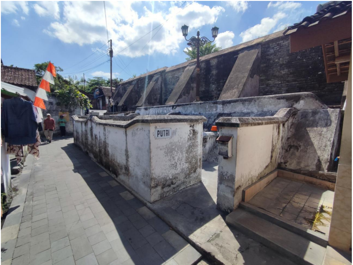
Gambar 2. Sumber Kemuning dilihat dari selatan