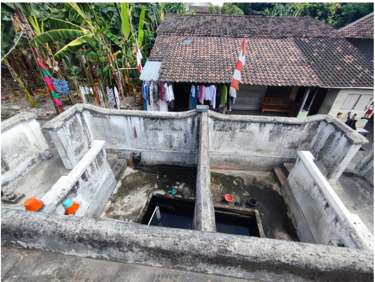
Gambar 3. Sumber Kemuning dilihat dari sisi timur