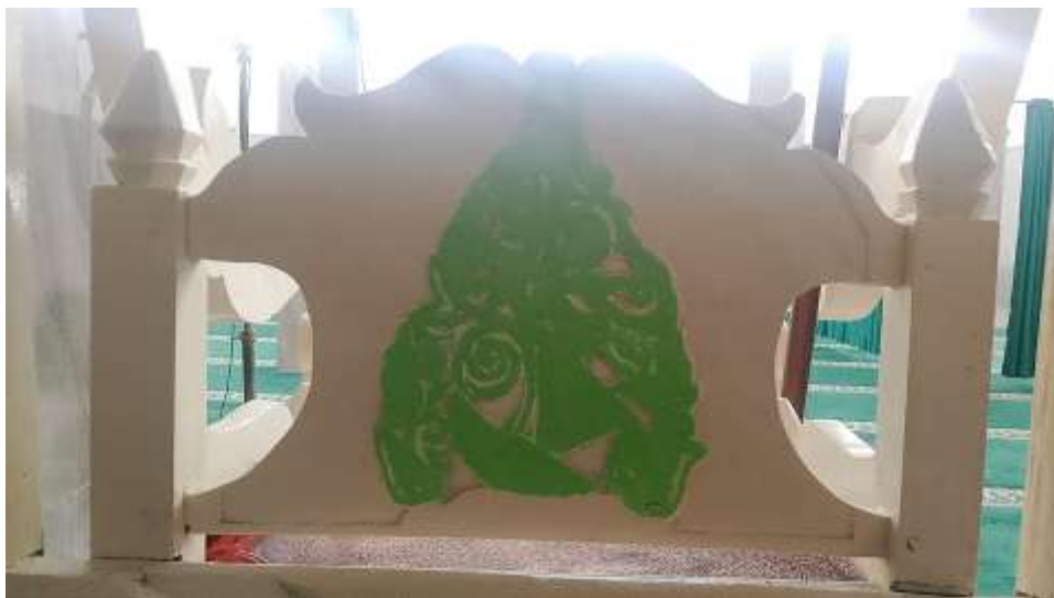
Gambar 6. Foto Hiasan pada bagian belakang sandaran tempat duduk khatib Mimbar Masjid Sabiilurrosyaad