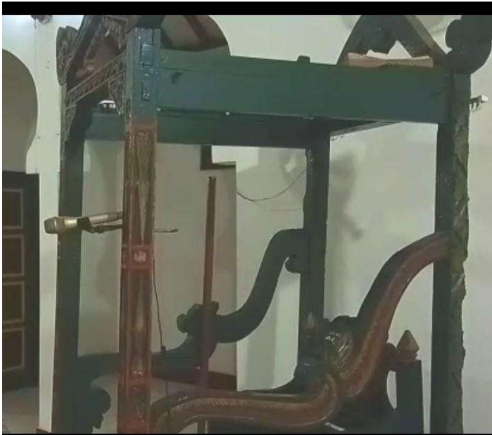
Gambar 3. Foto Lama Mimbar Masjid Sabiilurrosyaad