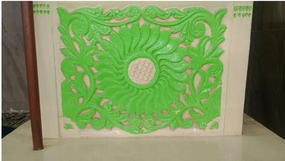
Gambar 5. Foto Hiasan pada tempat duduk khatib Mimbar Masjid Sabiilurrosyaad