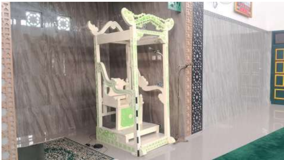
Gambar 1. Foto Mimbar Masjid Sabilurrosyaad