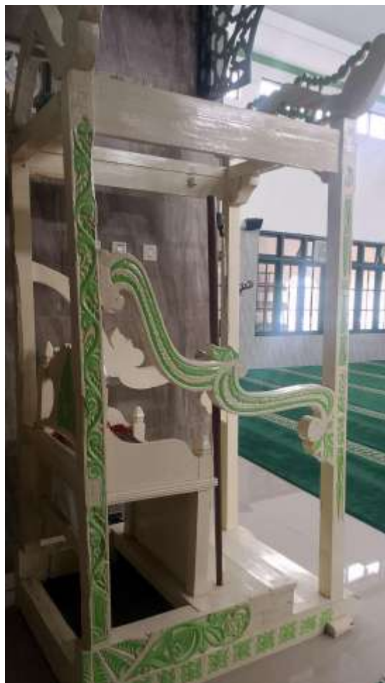
Gambar 4. Foto Hiasan Mimbar Masjid Sabiilurrosyaad