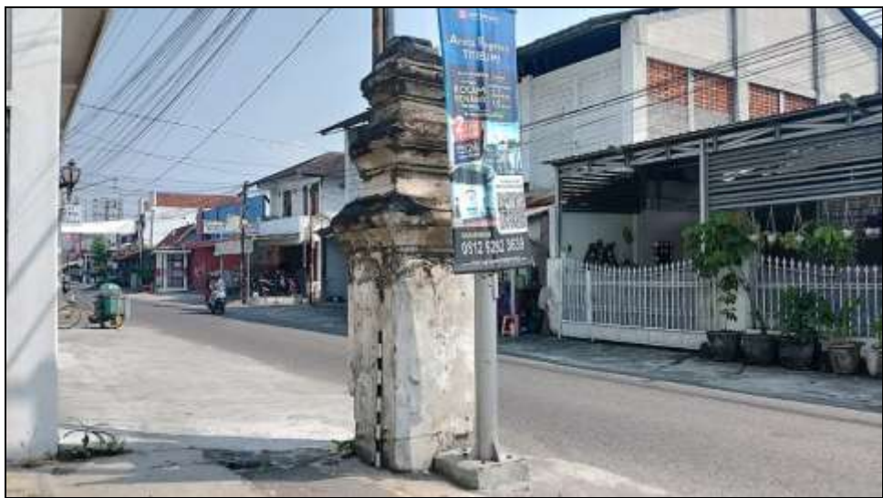
Gambar 1. Gapura Tegaltandan Barat dilihat dari arah tenggara