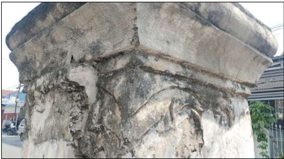
Gambar 2. Profil hiasan berupa daun-daunan pada pilar gapura dilihat dari tenggara