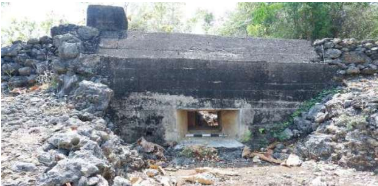
Gambar 3. Struktur Gua Jepang Nomor 4 dalam Lokasi Goa Jepang Bukit Durparang dilihat dari barat