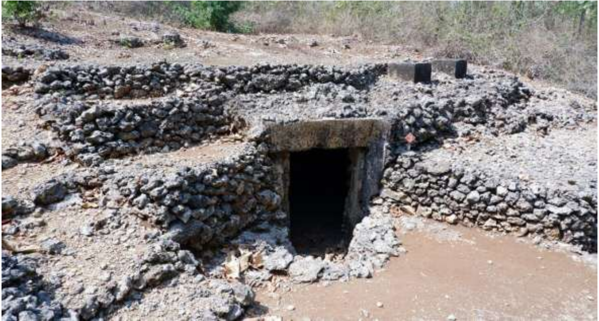
Gambar 2. Gua Jepang Nomor 3 dalam Lokasi Goa Jepang Bukit Durparang dilihat dari utara