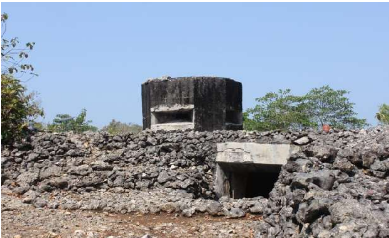
Gambar 1. Struktur atas Gua Jepang Nomor 2 dalam Lokasi Goa Jepang Bukit Durparang dilihat dari arah timur