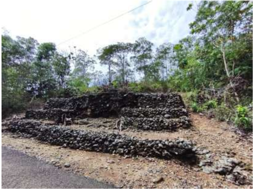
Gambar 2. Gua Jepang Nomor 6 dalam Lokasi Goa Jepang Bukit Mrangi dilihat dari utara