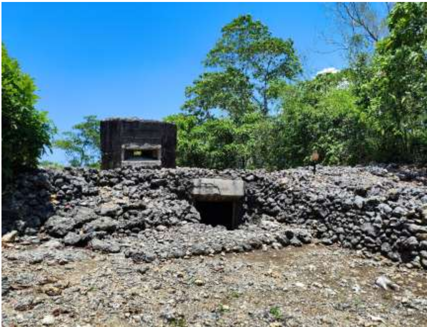
Gambar 3. Ruang atas bangunan Gua Jepang Nomor 7 dalam Lokasi Goa Jepang Bukit Mrangi dari arah barat