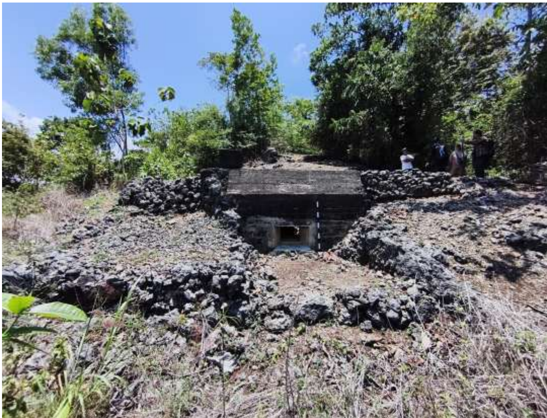
Gambar 1. Gua Jepang Nomor 5 dalam Lokasi Goa Jepang Bukit Mrangi tampak dari arah timur