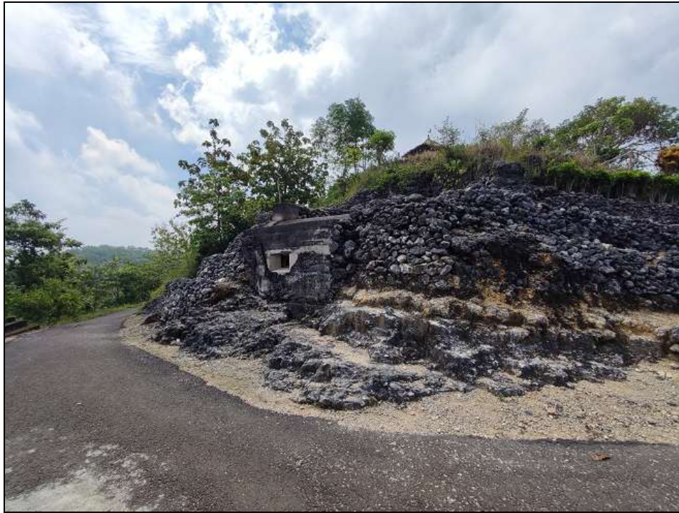
Gambar 3. Gua Jepang Nomor 10 dalam Lokasi Goa Jepang Bukit Gunungwesi dari arah barat daya