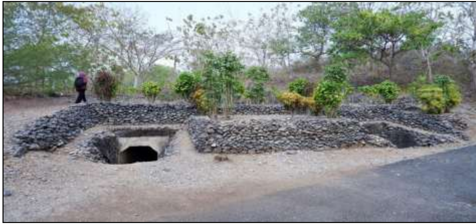
Gambar 1. Gua Jepang Nomor 8 dalam Lokasi Goa Jepang Bukit Gunungwesi tampak dari arah utara