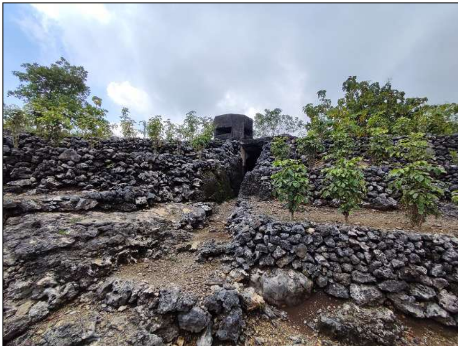
Gambar 4. Gua Jepang Nomor 11 dalam Lokasi Goa Jepang Bukit Gunungwesi dari arah timur laut