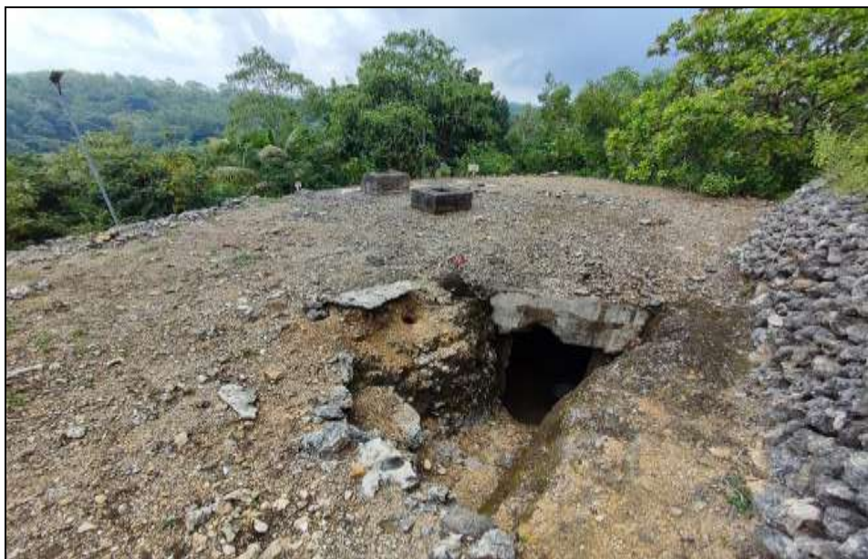
Gambar 2. Gua Jepang Nomor 9 dalam Lokasi Goa Jepang Bukit Gunungwesi dilihat dari timur laut