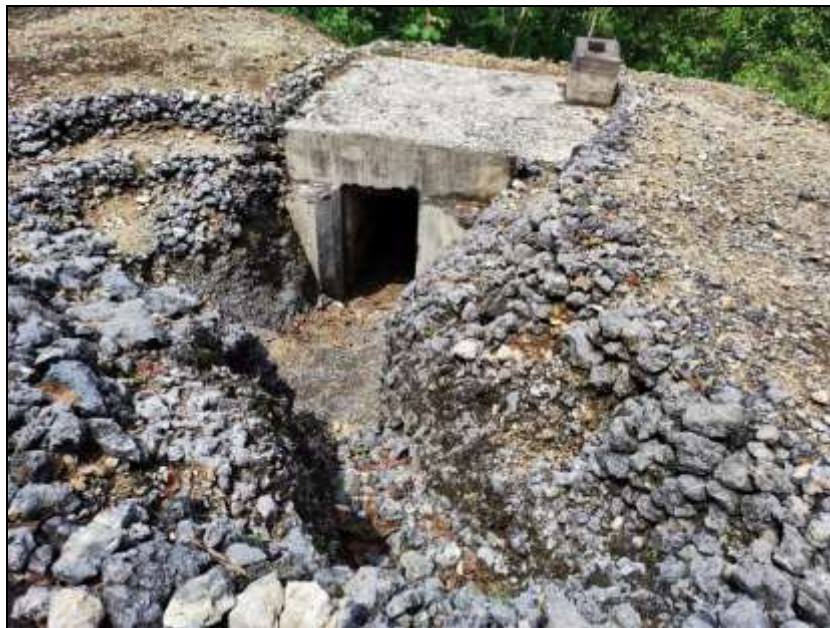
Gambar 1. Gua Jepang Nomor 13 dalam Lokasi Goa Jepang Bukit Ngancar dilihat dari barat daya