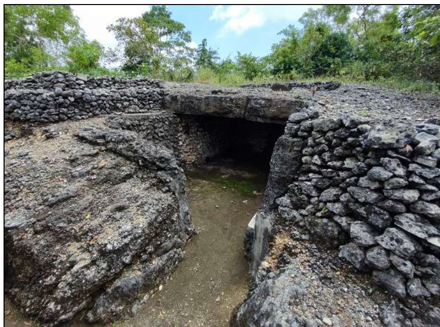
Gambar 2. Gua Jepang Nomor 14 dalam Lokasi Goa Jepang Bukit Ngancar dilihat dari timur laut