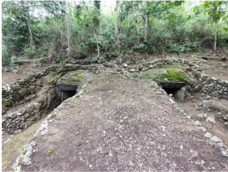
Gambar 1. Gua Jepang Nomor 15 dalam Lokasi Goa Jepang Lembah Doklumut dilihat dari timur