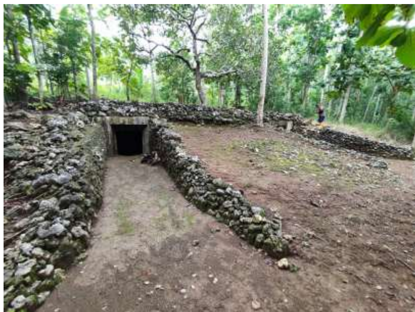
Gambar 2. Gua Jepang Nomor 16 dalam Lokasi Goa Jepang Lembah Doklumut dari arah barat laut