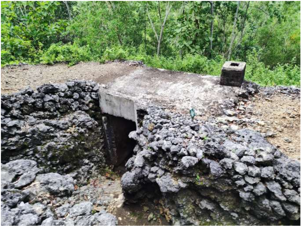
Gambar 2. Gua Jepang Nomor 18 dalam Lokasi Goa Jepang Bukit Doklumut dilihat dari barat laut