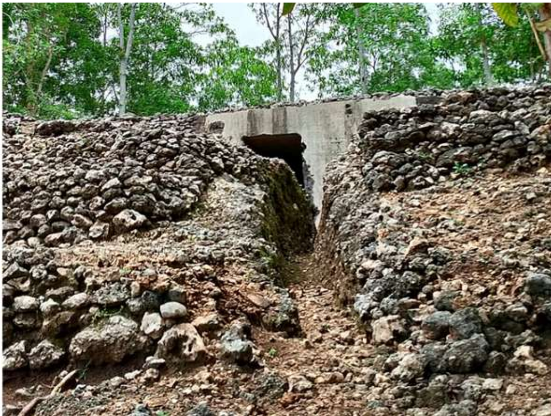
Gambar 1. Lubang pintu masuk Gua Jepang Nomor 17 dalam Lokasi Goa Jepang Bukit Doklumut dilihat dari barat